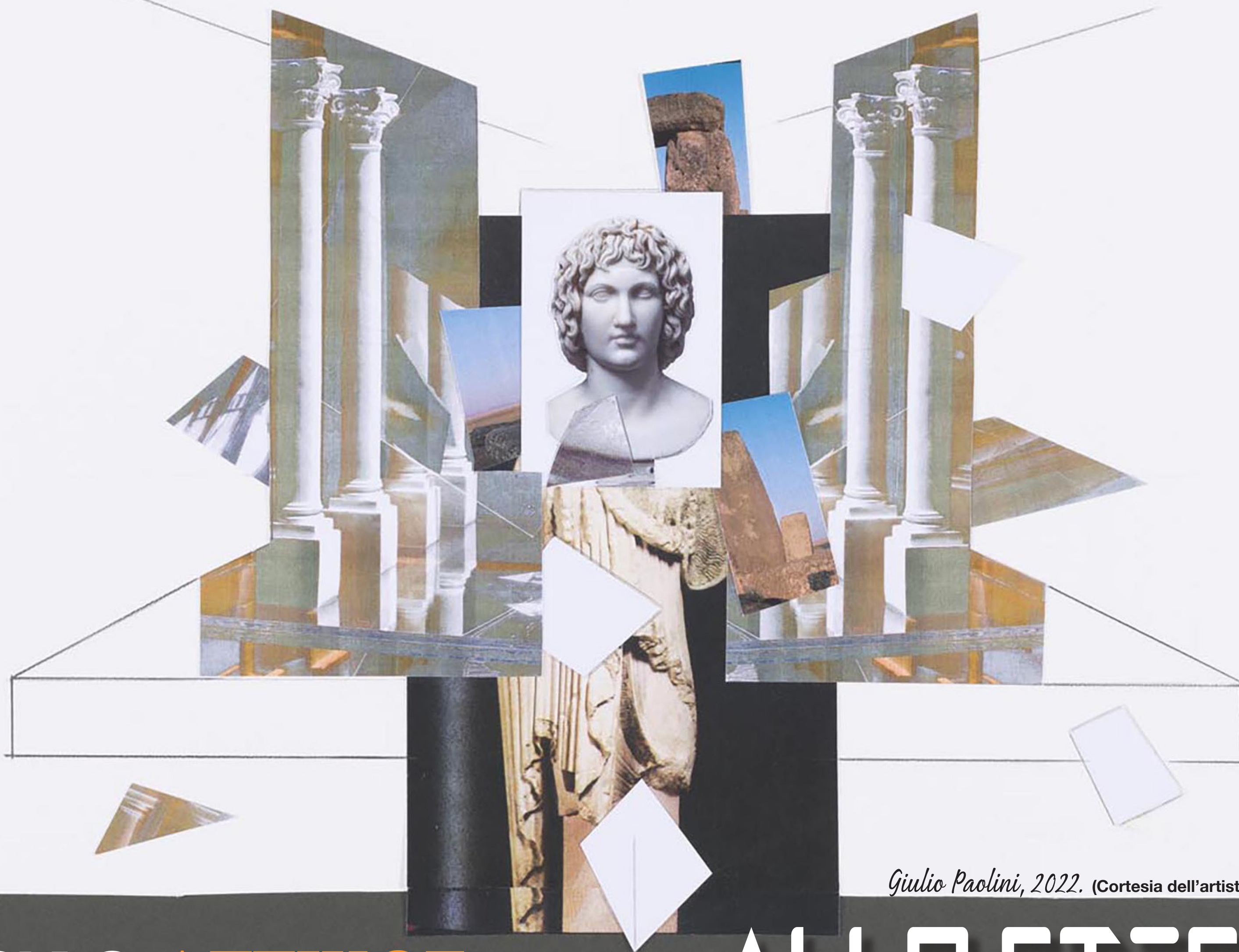
Giulio Paolini, 2022.

(Tucidide, La Guerra del Peloponneso, I, 20-24)