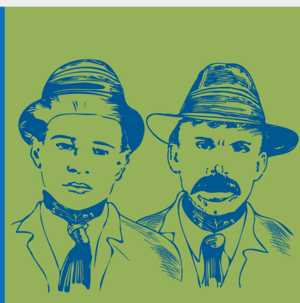
Sacco e Vanzetti